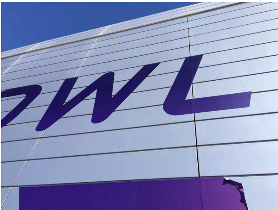
Figure 3. Point de départ de la dépose du côté supérieur gauche du graphisme chauffé