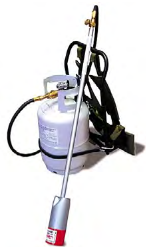
Figure 2. Exemple de tige à propane